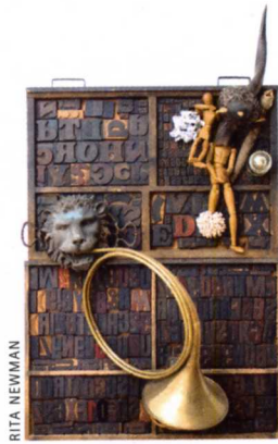
Wider das Erhabene: Die Kunsthalle Krems zeigt Arbeiten des Nouveau Réalisme. Seite 4